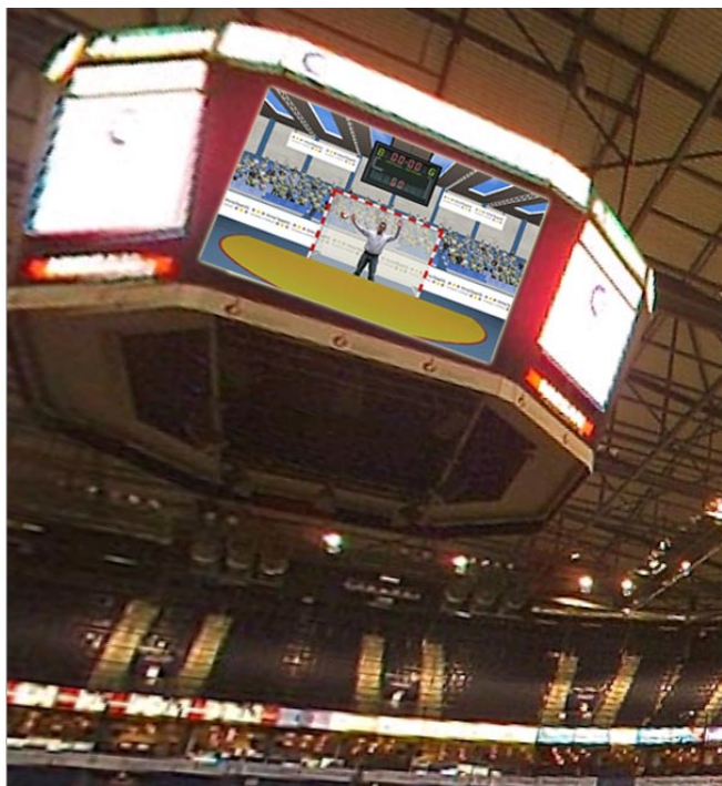
Beispiel für Live-Übertragung