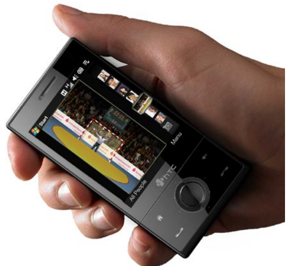
Visualisierung der Bluetooth-Funktion

Außerdem können die Bilder über eine Bluetooth-Software an alle Handys verschickt werden, die sich in Reichweite befinden und die diese Funktion unterstützen und aktiviert haben.