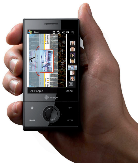
Visualisierung der Bluetooth-Funktion

Außerdem können die Bilder über eine Bluetooth-Software an alle Handys verschickt werden, die sich in Reichweite befinden und die diese Funktion unterstützen und aktiviert haben.