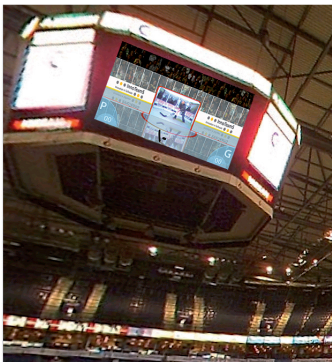
Beispiel für Live-Übertragung